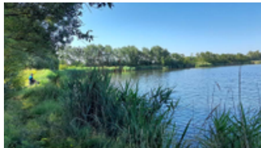
Afbeelding 5: Koolhofput Nieuwpoort geliefde plaats voor sportvissers

Koolhofput Nieuwpoort geliefde plaats voor sportvissers.