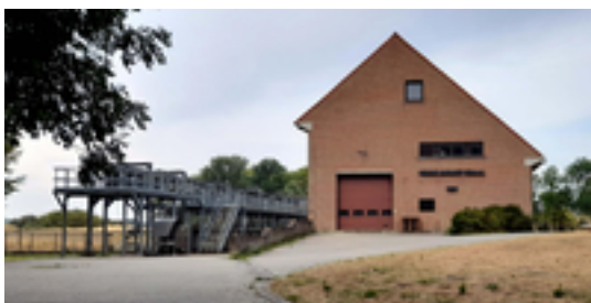
Afbeelding 8: Het pompghemaal 'Veurne-Ambacht'

Het pompghemaal bevat 5 automatisch werkende turbinepompen met elk een capaciteit van 5,5 m 3 /s. Deze pompen worden gestuurd op basis van een lokale waterpeiling. De totale capaciteit maakt van dit gemaal één van de grootste van Vlaanderen. Het water wordt verpompt naar een perskanaal waarin het water hoger komt dan de getijdenwerking van de zee. Bij laagtij op zee kan de Grote Beverdijkvaart ook gewoon uitstromen in zee langs het pompghemaal. Het pompghemaal wordt in opdracht van de VMM uitgebaut door de Polder Noordwatering Veurne.