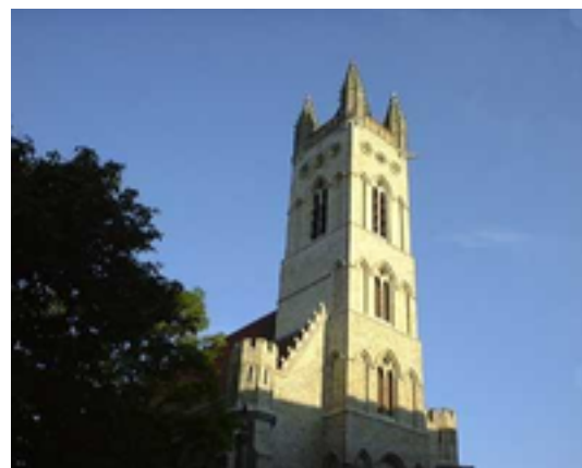
Afbeelding 30: Halle Nieuwpoort