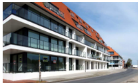
Afbeelding 25: Pieter Deswartelaan

De laan loopt langs de Veurnevaart. Ze is genoemd naar Pieter Deswarte (1838- 1914), stichter van de in 1969 gesloten scheikundige fabriek zogenaamd "Produits Chimiques". Deze fabriek werd afgebroken en vervangen door een modern gebouwencomplex. Tekst Friede Lox