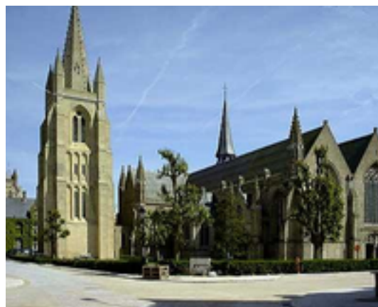
Afbeelding 28: Onze-Lieve-Vrouwekerk te Nieuwpoort

Nadat in 431 Maria was uitgeroepen tot 'Moeder van God' verzezen er nagenoeg in alle steden van Europa Maria- of Onze-Lieve-Vrouwekerken.