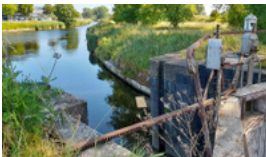
Afbeelding 26: Het sas van Dierendonck