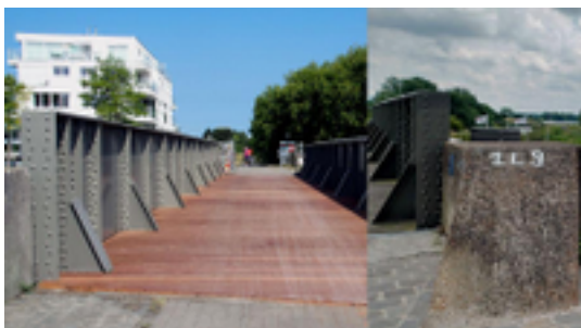
Afbeelding 1: De spoorwegbrug

De spoorwegbrug over de Veurnevaart werd gedemonteerd en kreeg voorafgaand aan de