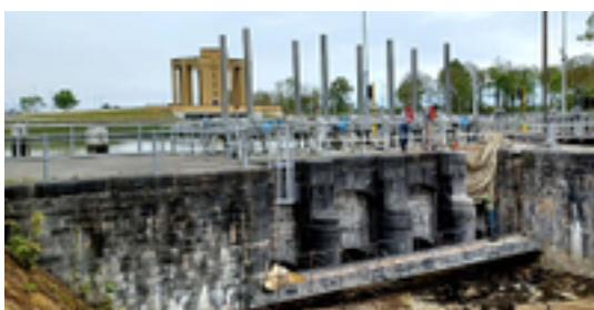
Afbeelding 19: De Veurnesluis en de uitwateringssluis

De Veurnesluis op de Veurnevaart is het eerste