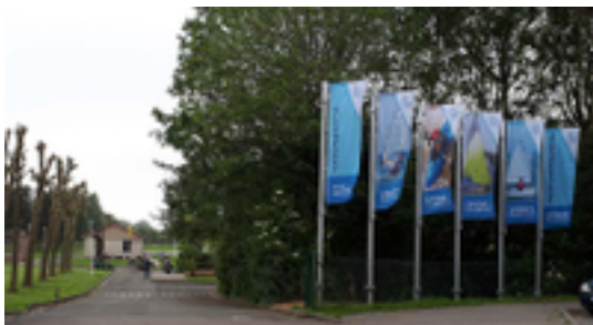
Afbeelding 11: Sport Vlaanderen Nieuwpoort