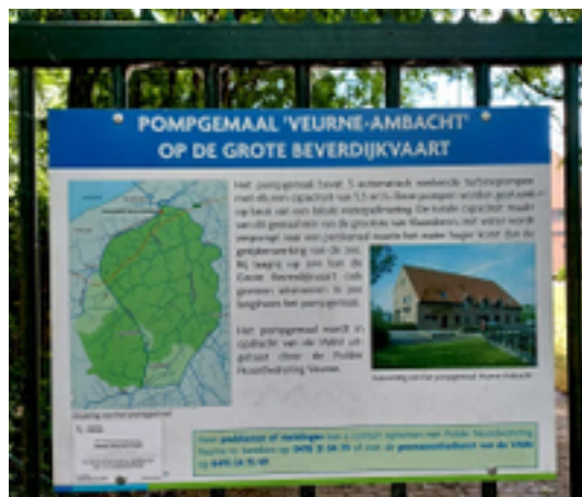
Afbeelding 9: Het pompghemaal 'Veurne-Ambacht'

Het pompghemaal bevat 5 automatisch werkende turbinepompen met elk een capaciteit van 5,5 m 3 /s. Deze pompen worden gestuurd op basis van een lokale waterpeiling. De totale capaciteit maakt van dit gemaal één van de grootste van Vlaanderen. Het water wordt verpompt naar een perskanaal waarin het water hoger komt dan de getijdenwerking van de zee. Bij laagtij op zee kan de Grote Beverdijkvaart ook gewoon uitstromen in zee langs het pompghemaal. Het pompghemaal wordt in opdracht van de VMM uitgebaut door de Polder Noordwatering Veurne.