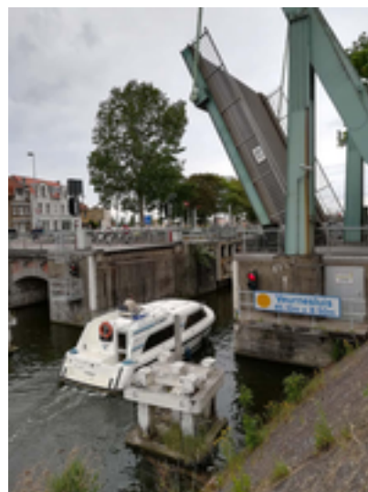
Afbeelding 20: De Veurnesluis en de uitwateringssluis

De Veurnesluis op de Veurnevaart is het eerste