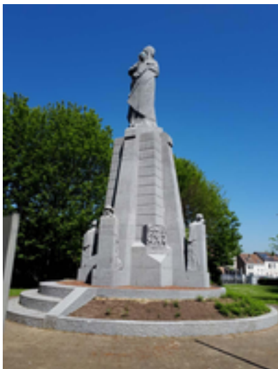
Afbeelding 14: Het Ijzergedenkteken

Ijzergedenkteken. Dit beeld van de Nieuwpoortse kunstenaar Pieter Braecke moest in het eeuwfeestjaar 1930 België voorstellen: een vrouw afgewend van de invaller uit het oosten, de kroon beschermend in de handen. De vier figuren tegen het voetstuk verbeelden de weerstand: een blinde, een gewonde, een zieke en een weerbare soldaat.