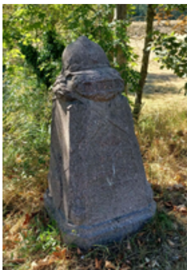
Afbeelding 12: Demarcatiepaal nummer 13

De demarcatiepaal nummer 13 bij de waterloop Wittebrug herinnert aan de Slag aan de IJzer en de onderwaterzetting van de IJzervlakte eind oktober 1914. Deze paal is één van de 22 demarcatiepalen, die in de eerste helft van de jaren 1920 zijn geplaatst door de Touring Club de Belgique, ter markering van symbolische plaatsen langs de voormalige frontlijn uit de Eerste Wereldoorlog. Deze demarcatiepalen, naar een ontwerp van de Franse beeldhouwer Paul Moreau-Vauthier, werden in drie varianten uitgewerkt: een Belgisch, Frans en Brits model. Hier betreft het een Belgisch model. Het is een geprofileerde rozegranieten zuil op een betonnen sokkel geplaatst, met piramidale opbouw, bekroond met een gesculpteerde Belgische helm (Adrianmodel), waarop een kenteken met een leeuwenkop is aangebracht. De helm is omlijst met een lauwerkrans. Op de zuil is een reliëf uitgehouwen