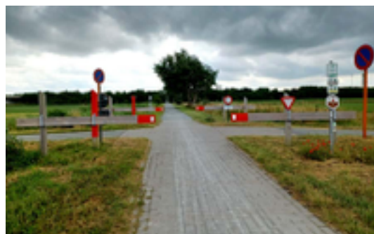
Afbeelding 6: De spoorwegbedding Nieuwpoort – Diksmuide

De spoorwegbedding van de in 1974 gedesaffekteerde spoorlijn nummer 74 tussen Diksmuide en Nieuwpoort vormde het sluitstuk van de Belgische verdedigingslinie tegen het Duitse leger.