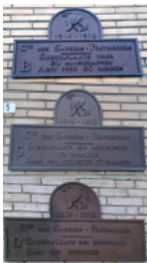
Afbeelding 23: Grote bronzen gedenkplaten aan gevels

Elke plaat geeft een schuilplaats weer van sectie behoorde tot de Section artistique de l'Armée Belge en ingekwartierd was bij de Sapeurs-Pontoniers, een genieeenheid die instond voor het onderhoud van sluizen en hydraulische inrichtingen van het Belgische front. De plaat is rechthoekig met een rondgebogen bovenzijde met vlakke uiteinden en een eenvoudige