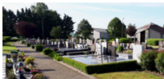
Afbeelding 10: De stedelijke begraafplaats

De stedelijke begraafplaats van Nieuwpoort, waar voor het eerst een overledene begraven werd op 3 november 1806, is gelegen ver buiten de bewoonde kern, op grondgebied van deelgemeente Sint-Joris. Deze begraafplaats van Nieuwpoort heeft sinds het begin van de 19de eeuw ook de evolutie gekend die men terugvindt op andere begraafplaatsen.