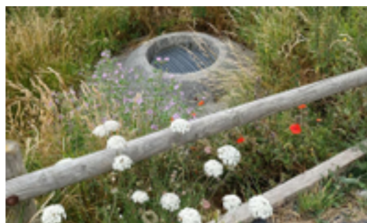
Afbeelding 2: De mitrailleurpost Tobruk - Veurnevaart

De betonnen constructie in de berm, op de hoek van het veld net ten zuiden van de brug over de Veurnevaart, ter hoogte van de kruising van de zogenaamde "Frontzate" met de Pieter Deswartelaan is een Duitse mitrailleurpost Tobruk. Een Tobruk (soms ook geschreven als Tobroek) is een soort bunker. De naam is afgeleid van de plaats Tobroek in Libië, waar deze bouwwerken in 1941 voor het eerst werden gebouwd door het Italiaanse leger. Later werd het model, een gewapende betonnen gevechtsruimte met een 8-hoekig of rond gat aan de bovenzijde, overgenomen door de Duitsers en zo vanaf 1942 in Europa geïntroduceerd. De bunker werd meestal door twee personen bemand, en deed meestal dienst als observatiepost of mitrailleurpost met een mortierstandaard. Het bouwwerk kwam voor als losstaande constructie, maar ook als onderdeel van een grotere bunker.