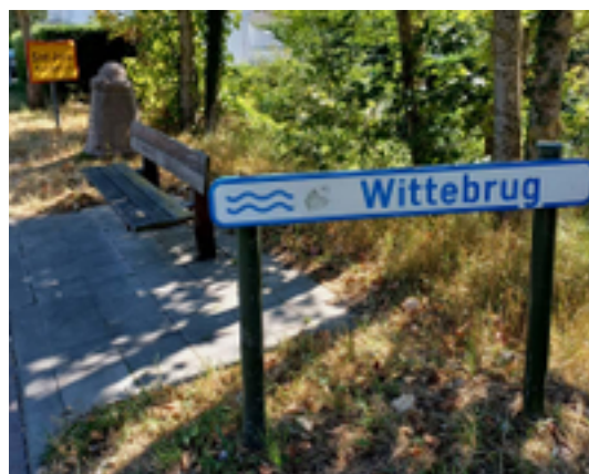
Afbeelding 13: Wittebrug