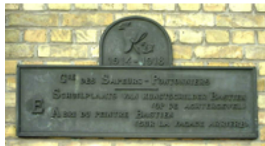
Afbeelding 24: Een grote bronzen gedenkplaat

Aan één der gevels van het huis nummer 37 was een grote bronzen gedenkplaat bevestigd. Ze herinnerde aan de locatie van de schuilplaats van de kunstschilder Bastien, die behoorde tot de Section artistique de l'Armée Belge en ingekwartierd was bij de Sapeurs-Pontoniers, een genieeenheid die instond voor het onderhoud van sluizen en hydraulische inrichtingen van het Belgische front. De plaat is rechthoekig met een rondgebogen bovenzijde met vlakke uiteinden en een eenvoudige omlijsting.