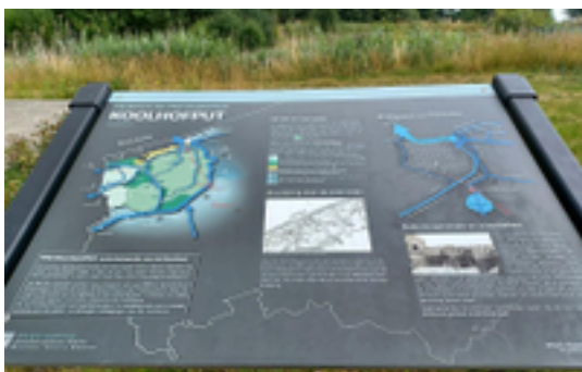
Afbeelding 4: Het provinciedomein 'Koolhofput'

Het provinciedomein Koolhofput is gelegen op de grens van Nieuwpoort en Koksijde. Het grenst aan de Veurnevaart en aan de provinciale Groene As de Frontzate, de voormalige spoorwegbedding tussen Diksmuide en Nieuwpoort. Deze diepe waterput van 10 ha is ontstaan door uitgraving van zand voor de aanleg van de A18 (Jabbeke-Veurne-Calais). Intussen is de Koolhofput een pleisterplaats voor mens en dier geworden. Watervogels en vissen enerzijds, vissers, wandelaars en natuurliefhebbers anderzijds voelen er zich thuis. In het kader van de landinrichting werd de Koolhofput verder voorzien van observatiehutten, paaiplaatsen, een wandelpad en beplantingswerken. Ook de hengelsporters komen aan hun trekken met de aanleg van een hengelplatform en een parking. Vlakbij vind je enkele oorlogsrestanten uit de Eerste Wereldoorlog.