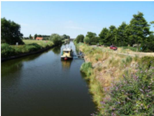
Afbeelding 31: Het Kanaal Nieuwpoort-Duinkerke (de Veurnevaart)

De Veurnevaart begint in Nieuwpoort aan het Veurnesas of de Veurnesluis, een onderdeel van de zogenaamde Ganzepoot aan de IJzer, waar het verbinding maakt met de IJzer, de Noordzee en de Plassendalevaart. De Veurnevaart loopt van Nieuwpoort oostwaarts, via Wulpen langs Adinkerke naar de stad Veurne. Na bijna 19 kilometer op Belgisch grondgebied stroomt de vaart verder in Frankrijk, langs Bray-Dunes en Zuidkote tot in Duinkerke.