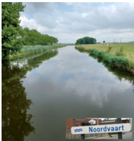
Afbeelding 7: De Noordvaart

Westkustpolders tussen de IJzer, de Veurnevaart en de Bergenvaart via de Slopgatvaart en de Grote Beverdijkvaart en vloeit zo doorheen de Overlaat van Veurne-Ambacht, de uitwateringssluis van de Noordvaart van het sluisencomplex 'de Ganzepoot' in de sluiskom om ten slotte afgevoerd te worden via de IJzer in de Noordzee.