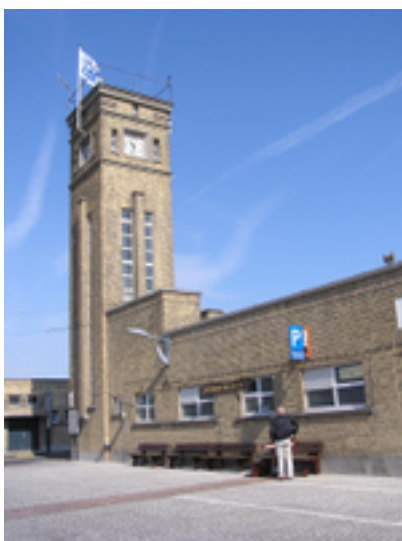
Afbeelding 22: Vismijn Nieuwpoort