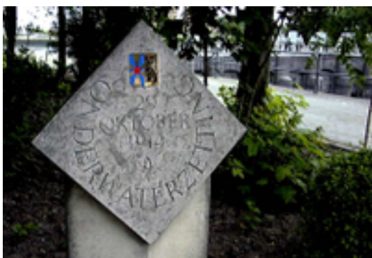
Afbeelding 18: De Naamsteen

Vorbij de Noordvaart (Overlaat Veurne-Ambacht) staat de naamsteen die aan de inundatie herinnert. We staan voor één van de 25 ruitvormige stenen platen, opgericht door de provinciale overheid op plaatsen die een belangrijke rol speelden in de Eerste Wereldoorlog, maar waar tot dan toe geen gedenkteken opgericht was.