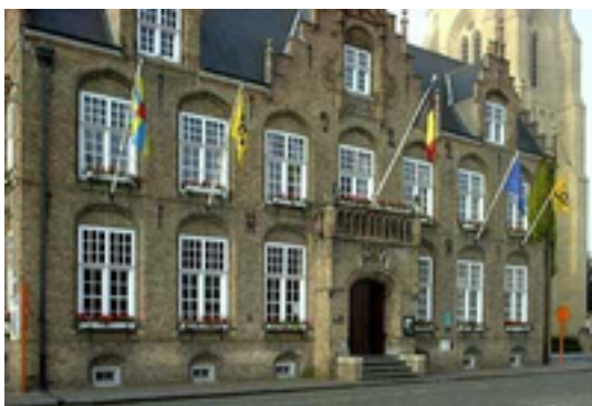
Afbeelding 29: Stadhuis Nieuwpoort