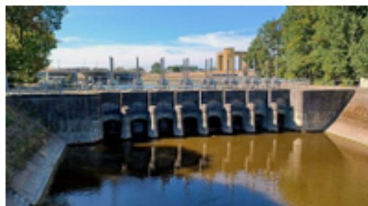
Afbeelding 16: De Noordvaart - Overlaat Veurne-Ambacht