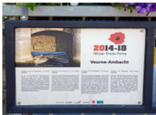
Afbeelding 17: De Noordvaart - Overlaat Veurne-Ambacht

De Overlaat van Veurne-Ambacht, is de uitwateringssluis van de Noordvaart. De Noordvaart verzamelt al het water van de polders tussen de IJzer, de Veurnevaart en de Bergenvaart. Ze wordt ook de Aflozingsvaart van Veurne-Ambacht genoemd. De