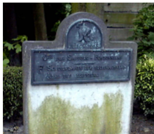
Afbeelding 21: Een gedenkplaat

Aan de overkant van de weg staat een gedenkplaat waar de militaire sluiswachters van de compagnie Sapeurs-Pontoniers een schuilplaats hadden. Ze