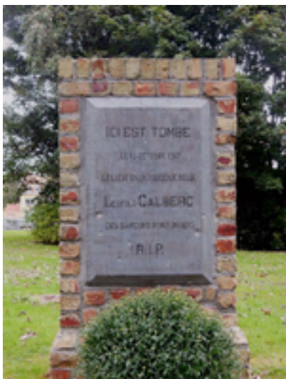
Afbeelding 15: Het gedenkteken voor luitenant Calberg

In het kleine park staat ook het eenvoudige gedenkteken van de Belgische genie, die bij het sluisencomplex het waterpeil van de inundatie in