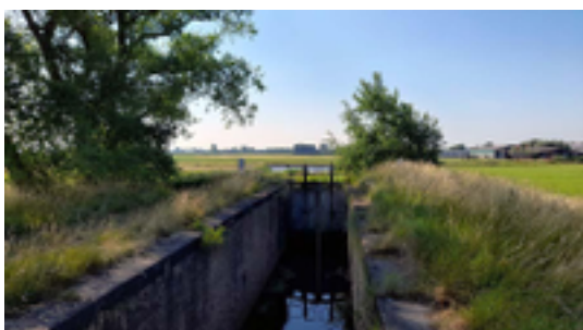
Afbeelding 27: Het sas van Dierendonck

Het sas van Dierendonck is een waterbouwkundige constructie gebouwd omstreeks 1867 waarin een schutsluis en een uitwateringssluice worden gecombineerd en waarbij de waterhuishouding in twee aparte waternetten, enerzijds voor de scheepvaart en anderzijds voor het polderbeheer, kan worden georganiseerd. Het sas maakt hierbij de verbinding tussen het bovenliggende scheepvaartwaternet (bestaande uit het Kanaal Duinkerke-Nieuwpoort en de IJzer, de Lovaart en het Kanaal Nieuwpoort-Plassendale en het onderliggende polderwaterloopenet van de Noordwatering Veurne (onder meer bestaande uit de Noordvaart of Veurne-Ambachtvaart, de Slijkvaart of Oostvaart en de Koolhofvaart). Het sas is beschermd als monument Sas van Dierendonck sinds 03-03-2015.