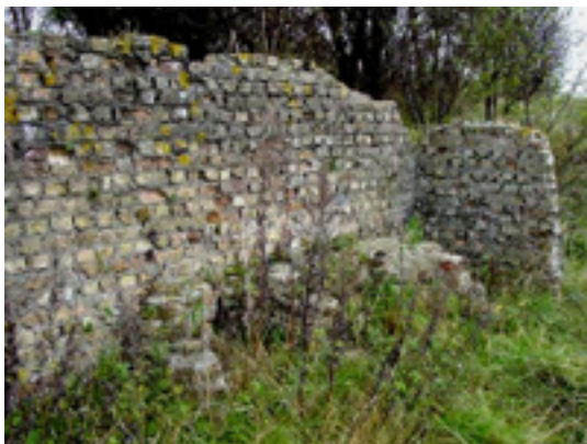
Afbeelding 3: Een bunker in de spoorwegberm

rustpunt met infoborden over de Frontzate en haar strategische rol tijdens WO I en de Spoorlijn 74.